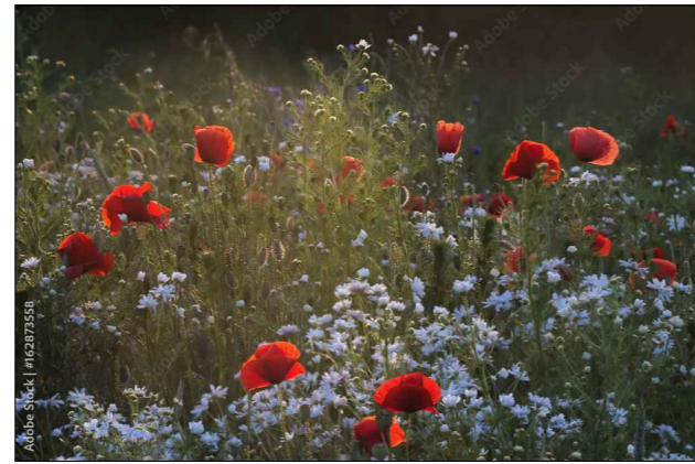
GRAFIKA NR 2