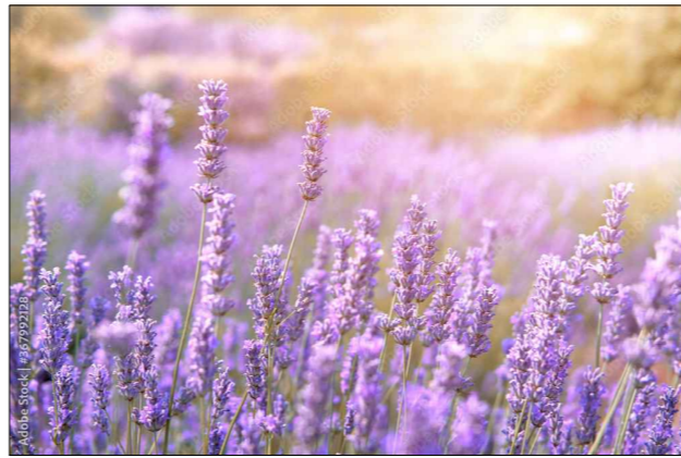
GRAFIKA NR 1