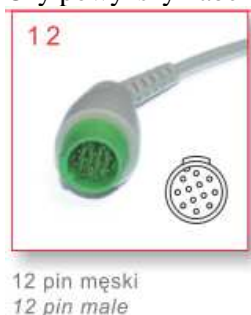
12 pin męski 12 pin female

Czy powyższy kabel ma mieć wtyczkę jak na załączonym zdjęciu?